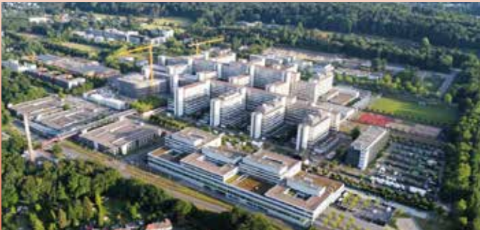
Blick über den Campus der Universität

Führung über das Gelände der Universität und der Fachhochschule Bielefeld