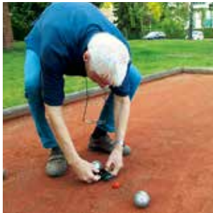
Jeder Zentimeter ist wichtig!

Ein Spiel beginnt immer mit dem Wurf des Schweinchens, auch cochonnet genannt, wenn man es etwas französischer haben möchte. Dann versucht jeder, seine Kugeln so zu werfen, dass sie so nah wie möglich beim Schweinchen landen. Dabei ist auch das Wegkicken der Gegner-Kugeln keineswegs unsportlich. Gewonnen hat am Ende der, dessen Kugel am nächsten beim Schweinchen liegt. Da geht es manchmal um Millimeter, und die werden akribisch nachgemessen.