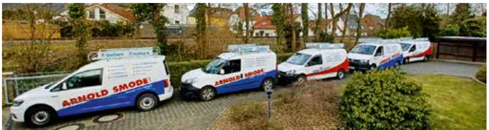
Die Firmenfahrzeuge an der Kupferheide

Arnold Smode und Bernd Spähn möchten sich für das in den vergangenen 60 Jahren entgegengebrachte Vertrauen bedanken und freuen sich auf eine zukünftige erfolgreiche Zusammenarbeit. (QB)