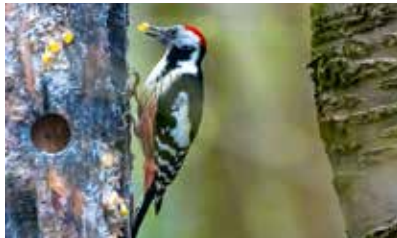
Mittelspecht am Futterholz