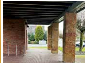
Bei Regen wird zwischen Turm und Kirche gespielt.

Ein Spiel beginnt immer mit dem Wurf des Schweinchens, auch cochonnet genannt, wenn man es etwas französischer haben möchte. Dann versucht jeder, seine Kugeln so zu werfen, dass sie so nah wie möglich beim Schweinchen landen. Dabei ist auch das Wegkicken der Gegner-Kugeln keineswegs unsportlich. Gewonnen hat am Ende der, dessen Kugel am nächsten beim Schweinchen liegt. Da geht es manchmal um Millimeter, und die werden akribisch nachgemessen.