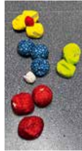
Boule-Kugeln für den Winter