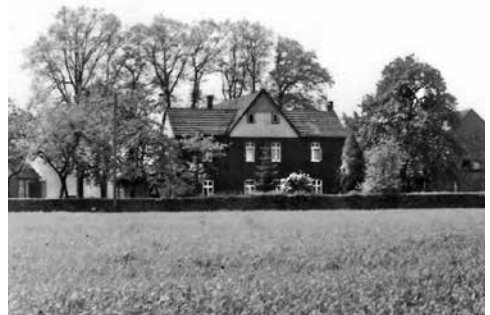
Der Hof Quelle Nr. 19 (Carl-Severing-Straße 247)