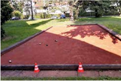
Die Boul-Bahn hinter der Kirche