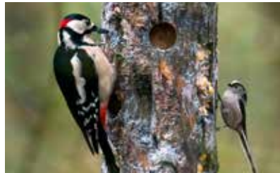
Buntspecht (Männchen) mit Tannenmeise auf dem Schulbauernhof Ummeln

Auf dem Schulbauernhof erfreuen wir uns seit elf Jahren am Anblick des Mittelspechtes im Winter. Leider ist noch kein Brutnachweis gelungen. Ob er wohl in diesem Jahr gelingt?