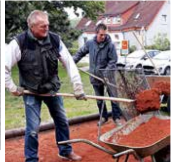
Arbeit an der Boul-Bahn

Beides! Das versicherten mir die drei Herren (Foto re.) vom Männerkreis „Kreuz und Quer“, denen ich neulich beim Boule-Spielen zugehört habe. Nicht draußen unterm freien Himmel – nein, im Flur des Gemeindehauses. „Wir haben seit Anfang 2000 zwar eine Boule-Bahn hinter der Kirche, aber im Winter spielen wir lieber hier drinnen.“ Dafür gibt es schöne bunte, mit Reis gefüllte Bälle aus Stoff. Manche bekommen von ihren Besitzern sogar Namen, so heißen die gelben hier zum Beispiel scherzhaft „Chinesen“.