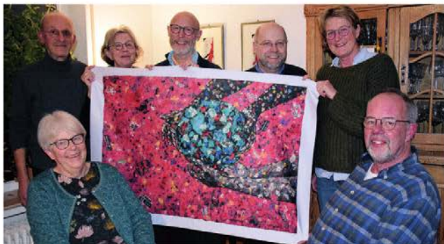
Das Team vom „Politischen Gottesdienst“ lädt ein, eigene Gedanken zu formulieren.

Nach der Pandemiepause hat das Vorbereitungsteam wieder einen Gottesdienst geplant, der den Blick auf Politik und Zeitgeschehen richtet, Fragen zu aktuellen Themen formuliert und mögliche Antworten aufzeigt. Auch die Form weicht von klassischen Gottesdiensten ab. Statt Orgelmusik spielt eine Band, das Publikum wird aktiv ins Ge-