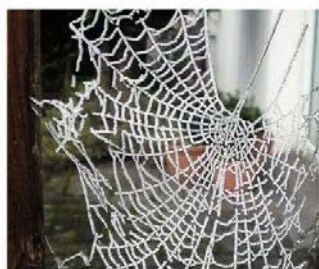
Der Winterzauber ist vorbei.