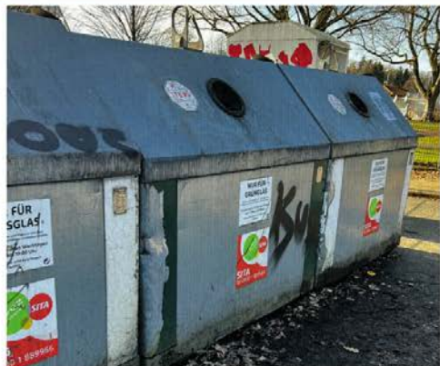
Flaschen-Container im Sumpfgelände

Also stellte ich meine leeren Flaschen in einen Korb und machte mich auf den Weg Richtung Theresienstraße, um mein Leergut zu entsorgen. Ich ahnte nicht, dass der Flaschen-Container dort am Ufer eines Sees gelegen war. Wer also nicht übers Wasser gehen kann oder Teleskop-Arme hat, muss wenigstens in der Lage sein, ein kleines Tänzchen hinzulegen, um die Container-Öffnungen zum Entsorgen der gläsernen Ressourcen zu erreichen.