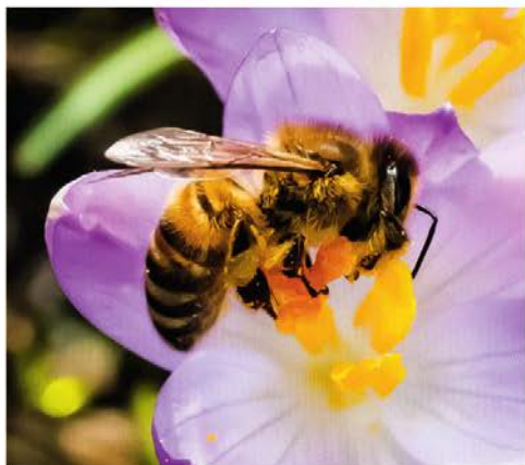
Der Krokus liefert den ersten Nektar und Pollen für die Honigbiene