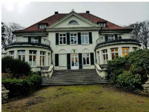
Der repräsentative Wohnsitz von Firmengründer Gustav Windel an der Krackser Straße