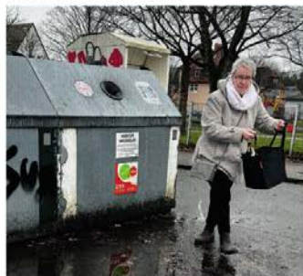
„Darf ich um ein Tänzchen bitten?“

Vielleicht klappt es ja besser, wenn sich der winterliche Regen verabschiedet hat, dachte ich. Sicher schlecht für den See, aber bestimmt besser für mich.