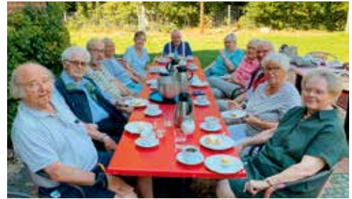
Gemütliche Kaffeetafel auf dem Landschaftspflegehof Ramsbrock in Senne

die neu gestalteten kinderwagen- und rollatorfreundlichen Hofwege zu den einzelnen renovierten Gebäuden erhielten. Klar machten die Verantwortlichen schon mal Werbung für ihren „Apfeltag“ am 3. Oktober, zu dem sie alle herzlich einladen. Dieser Hof ist dank vieler Spenden und Unterstützer wirklich ein Schmuckstück geworden, und Kinder und Erwachsene haben Glück, wenn sie dort an vielen unterschiedlichen Umweltprojekten teilnehmen können. Ein Besuch lohnt sich immer! (USG)