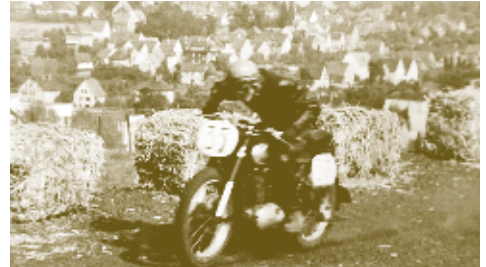
1960 ging die Zeit der Grasbahnrennen auf der Galgenheide ihrem Ende entgegen.

Trotz des schlechten Wetters waren etwa 4.000 Besucher auf die Galgenheide gekommen. Etwa 80 Fahrer hatten sich angemeldet. In jeder Klasse wurden 20 Runden à 600 m gefahren. Über den Gesamtsieg entschied die Punktzahl. Der erst 20 Jahre alte Steger aus Witten gewann überlegen mit seiner 175 cm 3 -Maschine.