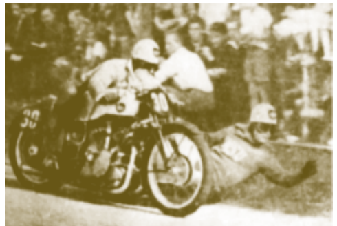
Schweres Motorrad mit Seitenwagen

Am 6.5.1951 fand das zweite Bielefelder Bergringrennen statt. 100 Fahrer aus der ganzen Region OWL nahmen teil. Es war ein strahlender Frühlingstag. Neun Rennen wurden bis 18 Uhr gefahren. 20.000 Bielefelder hielten den Atem an – so spannend war es. Manche Motorräder jagten ohne