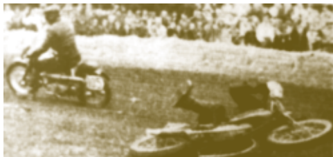
Durch das extreme Wetter kam es zu vielen Stürzen.

Läufen der 175 cm 3 -Klasse und bekam als Belohnung die als Hauptpreis ausgesetzte Dürkopp 150.