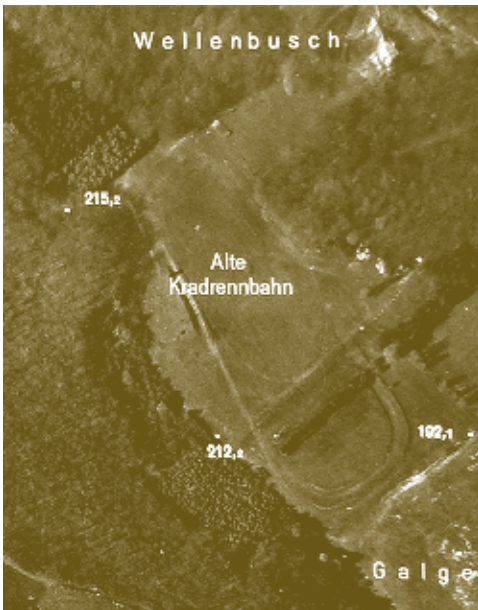
Luftbildatlas der Stadt Bielefeld 1975, 1: 5000, S. 64 Quelle

Nach dem Ende des Zweiten Weltkrieges kam der Motorsport in Deutschland nur zögerlich in Gang. Im Mai 1950 gab es nach elf Jahren Zwangspause wieder das erste Eilenriede-Rennen in Hannover. Die größte Grasbahn war der Teterower Bergring in Mecklenburg. Die 1930 dort errichtete Rennbahn war 1.800 m lang. Am 28. August 1949 konnte das erste Rennen nach dem Zweiten Weltkrieg auf dem Bergring gestartet werden. Auch heute noch werden dort jedes Jahr zu Pfingsten Wettkämpfe ausgetragen. Im Herbst 1950 fand das 1. Rennen auf der Galgenheide statt. Die Grasbahn in Quelle erinnerte viele Fahrer und Besucher an den Bergring in der Mecklenburger Schweiz.