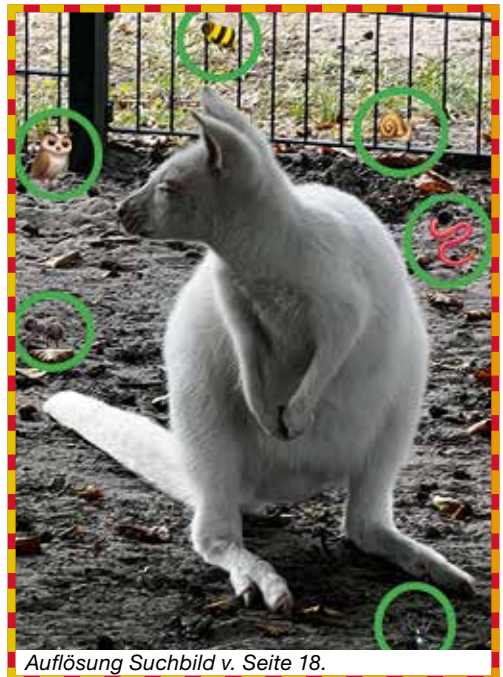
Auflösung Suchbild v. Seite 18.

Für das leibliche Wohl aller Besucherinnen und Besucher sorgen viele ehrenamtliche Helfer und bieten ein vielfältiges Angebot an, sodass keiner hungrig und durstig nach Hause gehen muss. Darüber hinaus können diverse Hofprodukte käuflich erworben werden. Der immer wieder stark nachgefragte Fotokalender des Schulbau-