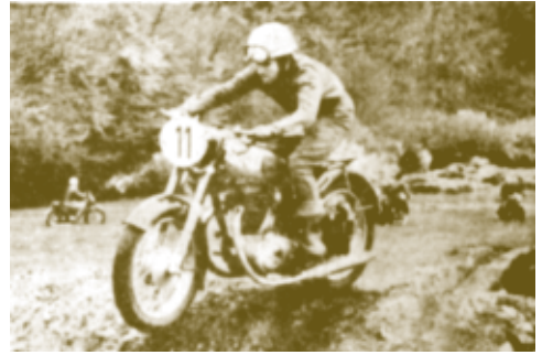
„Sprungschanze“ auf der Galgenheide

Die zerklüftete Bergwiese ist mit Sprunghügeln, Bodenwellen und Querriegeln in der steilen Rennbahn versehen worden. So wurde sie zu einer ausgezeichneten Moto-Cross-Arena. Dieser neue Rundkurs war 600 m lang.