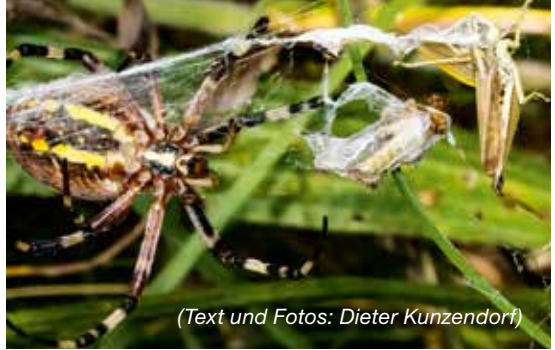
(Text und Fotos: Dieter Kunzendorf)

Noch vor 50 Jahren war das Vorkommen der Zebraspinne auf wenige warme Gebiete in Deutschland beschränkt, heute hat sie sich bis Skandinavien ausgebreitet. Es gibt also auch Gewinner der Klimaveränderung. Dieter Kunzendorf: „Für mich ist sie wunderschön. Sie ist 2 1/2 cm groß, genauer: das Weibchen. Wie bei vielen Spinnen lebt das kleinere Männchen gefährlich; oft überlebt es die Paarung nicht. Forschungen haben ergeben, dass nach Kannibalismus die Eier schwerer sind. Auch so kann ‚Mann‘ zur Arterhaltung beitragen. Hauptbeute sind Heuschrecken, passend zu meinen Fotos. Die Spinne spritzt Verdauungssaft in die Beute und saugt sie dann aus. Ein wahres Wunderwerk ist das Netz. Aber gegen Arachnophobie (Spinnenangst) ist wohl kein Kraut gewachsen.“