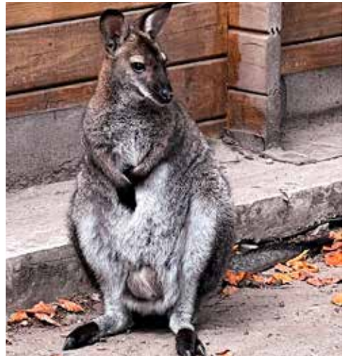
Der neue Känguru-Nachwuchs versteckt sich noch in Muttters Beutel.