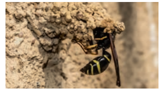
Spät dran: Auch am 8. Juni wird noch gebaut.