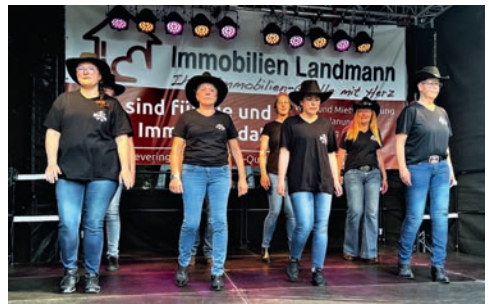
. . . endlich ist es soweit

sich einen Cowboy-Hut aufzusetzen und mitzutanzten, gehen Sie doch einfach mal zu den Schnuppertagen am 11. Juli oder am 3. Oktober.