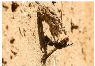
Baubeginn am 22. Mai

„In der Regel beginnen sie mit dem Bau Mitte Mai; so ist das Foto Nr. 1 vom 22. Mai. Hier hat die Wespe gerade ein Bröckchen in den Mandibeln (Kauwerkzeugen). Anfang Juni sammeln sie für ihre Brut knallgrüne Larven eines Rüsselkäfers (Foto Nr. 2). Sie sammeln viel: Hinter jedem ‚Schornstein‘ sind 5 bis 7 Brutzellen vorhanden; pro Zelle ein Ei, pro Ei 10 bis 30 (!!!) Larven; bei 50 „Schornsteinen“ im vergangenen Jahr wären das mindestens 50x5x10 Käferlarven, wenn alle Brutzellen versorgt wären. Dieses Jahr sind sie spät dran mit dem Bau: Foto Nr. 3 ist vom 8. Juni, also zweieinhalb Wochen später. Die meisten Brutgänge sind noch geschlossen. Ich bin gespannt, ob sie so spät noch Käferlarven finden.“ (Iü.)