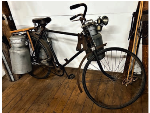
Milchtransport per Fahrrad