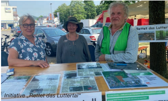
Initiative „Rettet das Luttertal“