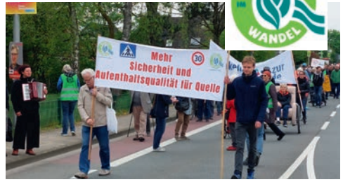
Demo am 29. April 2022

Nun ist die Frage: Wie geht es weiter? Es ist wichtig, dieses Anliegen nachdrücklich zu verfolgen. Dies kann dadurch geschehen, dass man eine persönliche Petition an den Bürgermeister und den Rat der Stadt richtet. Auf der Seite der Deutschen Umwelthilfe ( www.duh.de/tempo30/ ) finden Sie eine Anleitung, wie Sie die Petition stellen müssen. Das ist recht einfach.