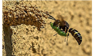
Hier wurde die Larve eines Rüsselkäfers erbeutet.