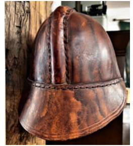
Feuerwehrhelm aus Leder