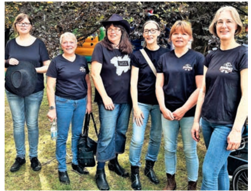
Warten auf den Auftrittsbeginn . . .