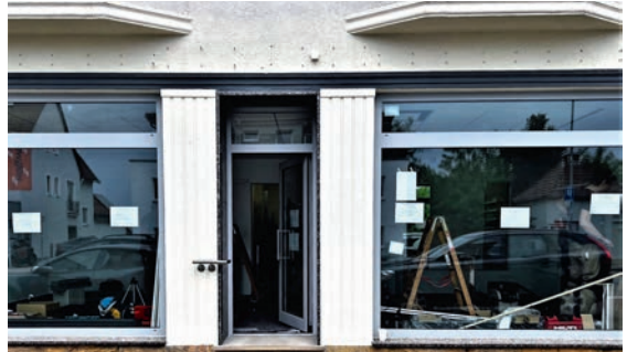
Optik Mühlenweg während der Verschönerungsphase . . .

Die Handwerker sind fertig, die Räume hell und einladend eingerichtet und auch die Schaufenster sind wie-