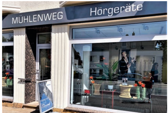
. . . und danach!