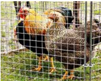
Zwerg Wyandotten, orangefarbig gebändert