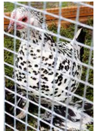
Federfüßiges Zwerghuhn, weiß getupft

Rassegeflügelzüchterverein Quelle-Brock (seit 1892)