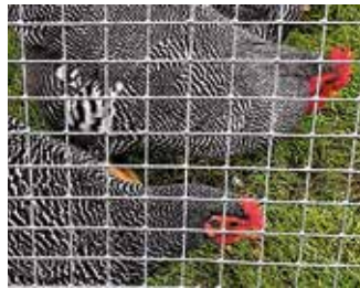
Zwerg Plymouth Rocks, gestreift