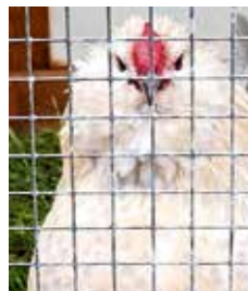
Antwepener Bartzweg, isabellfarbig