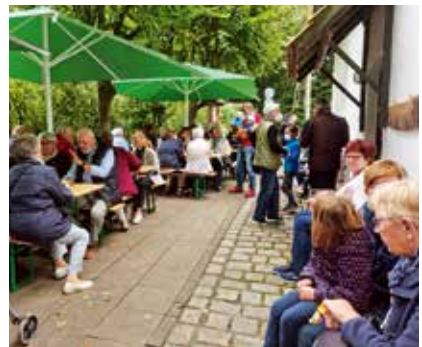
Besucher aus nah und fern lassen sich mit Kaffee, Kuchen und Mühlenbrot verwöhnen.