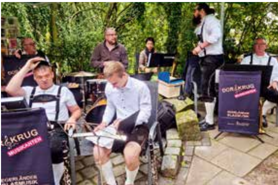
Egerländer Blasmusik mit den Dorfkrug-Musikanten aus Lage am 19. September