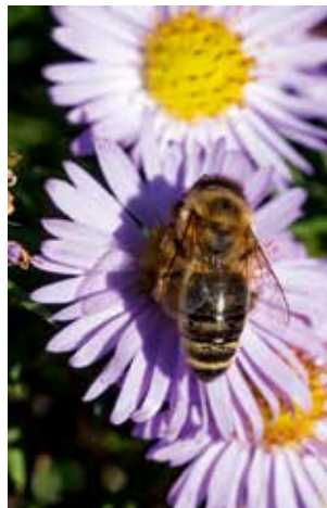
Honigbiene auf Herbstaster

Gesellschaftliche Entwicklungen einschätzen: Ein Gesprächskreis zu aktuellen, auch kontroversen Themen kann ein- oder zweimal pro Monat stattfinden, z. B. im Gemeinschaftsraum in Quelle, Terminfindung und Themen werden mit allen abgestimmt. Ihr Interesse bitte anmelden: ☎ 0521-150385