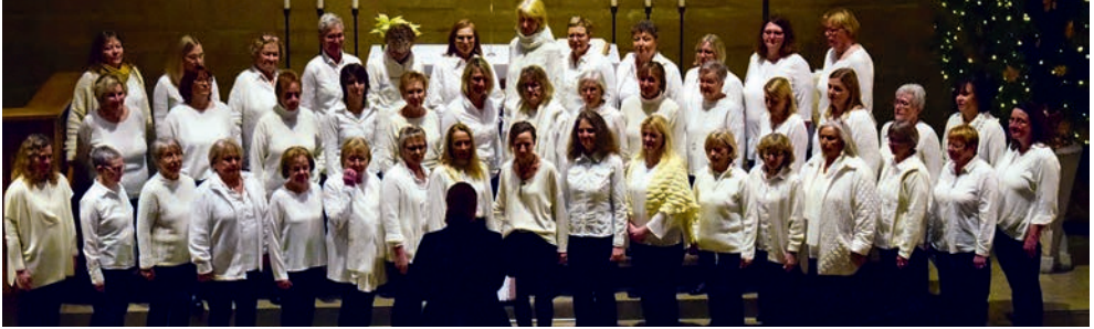
Bis auf den letzten Platz besetzt waren die Bänke der Johanneskirche beim Weihnachtskonzert der Ehemaligen des Bielefelder Kinderchores am 4. Januar

Wann hat ein Dankeschön so wunderbar geklungen? Mit einem stimmungsvollen Weihnachtskonzert haben die Ehemaligen des Bielefelder Kinderchores 450 Menschen in der Johanneskirche verzaubert. Viele altbekannte Weihnachtsweisen erklangen in der Kirche, ebenso professionell wie stimmungsvoll interpretiert von den Sängern unter der Leitung von Sandra Botor. Traditionelle Weihnachtslieder, winterliche Weisen und dazu ein „White Christmas“ – perfekter musikalischer Höhepunkt und Abschluss der Weihnachtszeit.