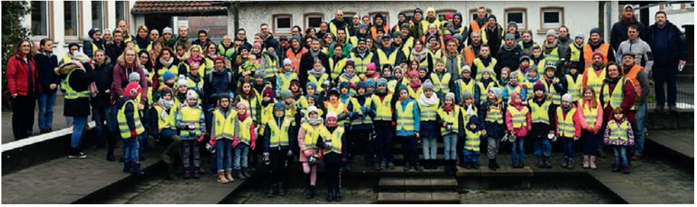
120 Helfer sammelten 1.142 Weihnachtsbäume ein.