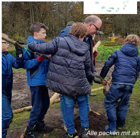
Alle packen mit an