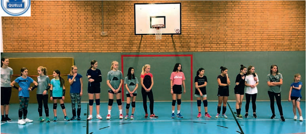
Volleyball beim TuS Quelle: Das Bild entstand beim gemeinsamen Training von U12/U14 und U16; auffällig ist der Größenunterschied der beiden äußeren Spielerinnen.

Seit 2017 ist die Volleyball-Abteilung des TuS Quelle auch im Kinder- und Jugendbereich aktiv. Angefangen hat alles mit einer Volleyball-AG im Rahmen der Offenen Ganztags-Schule an der Grundschule Quelle. Freitags nach der Schule trafen sich interessierte Schüler.