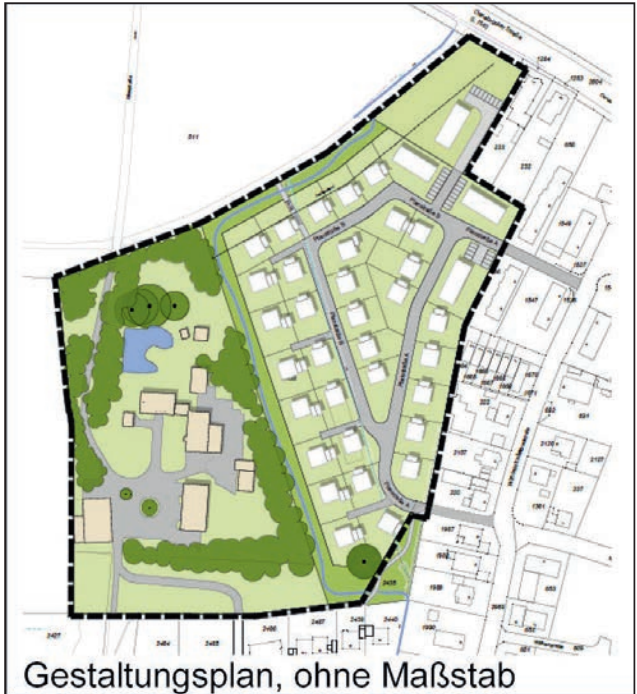
Gestaltungsplan, ohne Maßstab

zum Klimaschutz. Für den Stadtbezirk und die gesamte Stadt Bielefeld ist es deshalb besonders wichtig, dass Biolandwirtschaft und vorhandene Betriebe gefördert und gestützt werden. Der geplante Bebau-