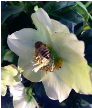
Klimawandel? – Bienenbesuch an der Christrose Mitte Januar.