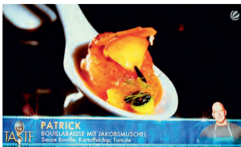
Alles auf einem Löffel

In der nächsten Runde am 6. Oktober kreierte Büscher einen perfekten Löffel mit Blitz-Sauerkraut, Pumpnickel-Rösti, Meerrettich und Apfel. Beim Teamkochen galt es, Gerichte für Heiratsanträge herzu-