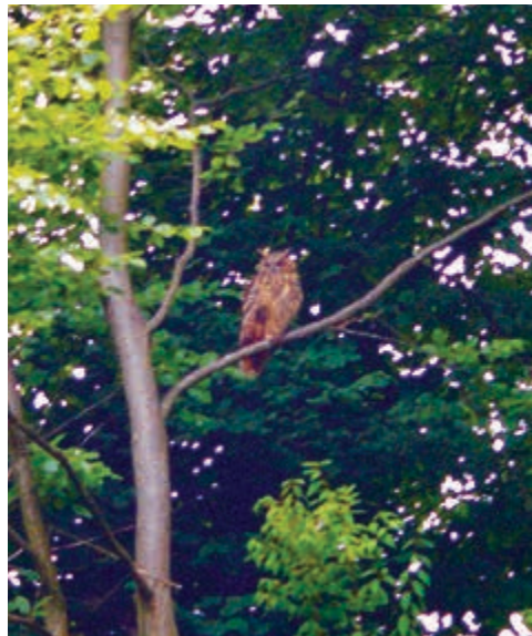
Uhu ( bubo bubo), gesehen im Luttertal am 30.08.2018

Wir bedanken uns bei ihm dafür, dass er dem Queller Blatt einige Aufnahmen des streng geschützten Greifvogels zur Verfügung stellte. Den genauen Ort der Sichtung wollen wir allerdings aus Gründen des Vogelschutzes nicht verraten. (lÜ.)