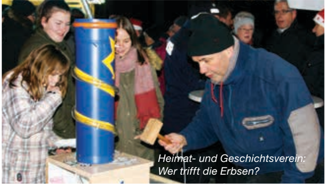
Heimat- und Geschichtsverein: Wer trifft die Erbsen?