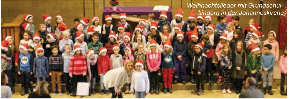
Weihnachtslieder mit Grundschulkindern in der Johanneskirche