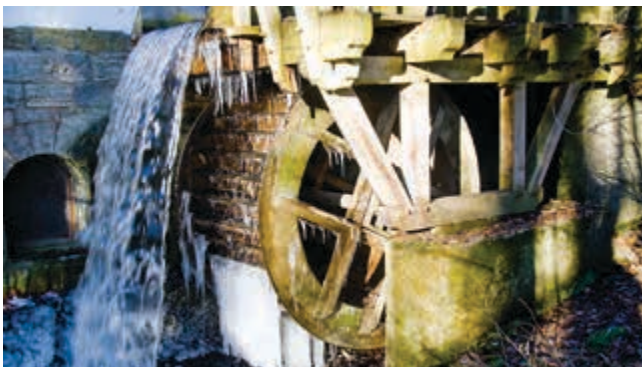
Niemöllers Mühle im Februar 2016

Tel.: 0521 / 43 20 20 | fischer-abfall.de