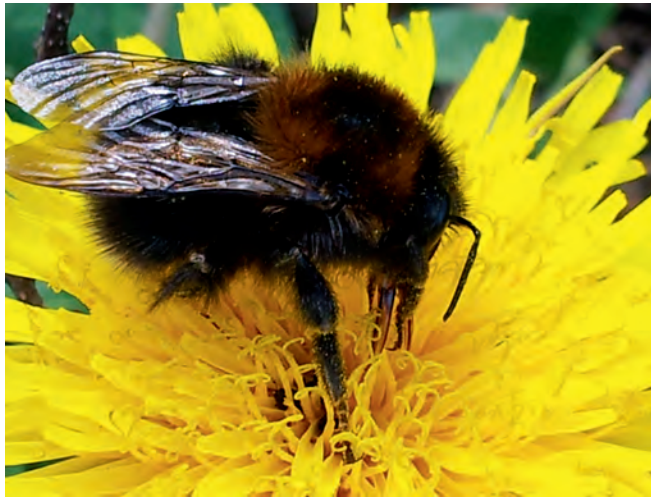
Hummeln sind friedliche Insekten und durch das Bundesnaturschutzgesetz geschützt.

Die Hummeln ( Bombus ) sind eine zu den Echten Bienen gehörende Gattung staatenbildender Insekten. Die im weiblichen Geschlecht über einen Wehrstachel verfügenden Hautflügler (Hymenoptera) gehören zu den Stechimmen, auch Wehrimmen genannt. Sie kommen überwiegend in den gemäßigteren und kühleren Regionen der Nordhalbkugel vor. Ein Hummelvolk besteht je nach Art aus etwa 50 bis 600 Tieren und einer Königin. Die Mehrzahl der Tiere sind Arbeiterinnen, daneben gehören zum Volk auch Männchen, die wie auch bei den Honigbienen Drohnen genannt werden, sowie Jungköniginnen. Ein Volk überlebt in Europa nur einen Sommer und ist gewöhnlich im September abgestorben. Es überwintern einzig die begatteten Jungköniginnen, die im frühen Frühjahr des nächsten Jahres allein auf sich gestellt mit der Anlage eines Nestes und damit der Gründung eines neuen Staates beginnen. Solche Königinnen erreichen ein Alter von bis zu zwölf Monaten, von denen sie bis zu acht Monate in Winterruhe verbringen. Drohnen und Arbeiterinnen erreichen dagegen in der Regel nur ein Alter von drei bis vier Wochen. Während Honigbienen erst ab einer Außentemperatur von mindestens 10 °C ausfliegen, sind Hummelköniginnen im zeiti-