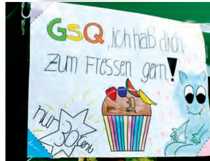
(lü./Fotos: Gesamtschule Quelle)

Elternpflegschaft, Schulaufsicht und Bezirksbürgermeisterin, musikalischen Darbietungen von Lehrerchor („GSQ-Rap“, „Only You“), Schüler-Ensemble („Un poquito cantas“) und Lehrerband („Fly me to the moon“) sowie Poetry-Slam-Vortrag begann das bunte Treiben auf dem Schulhof mit kulinarischen Köstlichkeiten und weiteren unterhaltsamen Angeboten.