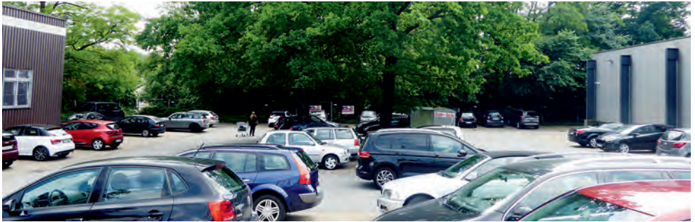
Blick auf den heutigen Parkplatz am ALDI-Markt mit dem Gehölzbereich auf dem Nachbargrundstück im Bildhintergrund