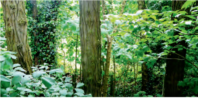
Dieser Baumbestand hinter den Wohnhäusern an der Marienfelder Straße soll für den ALDI-Neubau abgeholzt werden

zentrum von Quelle eine flächenfressende, eingeschossige Markthalle zu setzen, widerspricht einer modernen städtebaulichen Planung. Die Stadt Bielefeld wächst, es werden immer mehr Naturflächen für Wohnen und Gewerbe benötigt. In dieser Lage müssen alle Möglichkeiten des flächensparenden Bauens genutzt werden. Außerdem sollte gerade im Zentrumsbereich von Quelle darauf geachtet werden, dass sich alle Neubauten architektonisch in das Ortsbild einpassen.