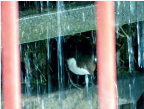
Dieses Bild aus dem April zeigt die Wasseramsel vor dem Nest im Wasserrad.

Wer genau hinschaut, kann sie dort erkennen.