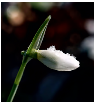
Schneeglöckchen kündigen den Frühling an.