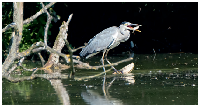
Dem Fischreiher an Niemöllers Teich hat's geschmeckt.