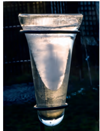
Eiskunst – Regenmesser im Gegenlicht

Lieber älterer Mitbürger , wer fasst nach vielen langen Jahren Autofahren den mutigen Entschluss, seinen gepflegten Wagen nicht mehr selbst zu fahren und möchte sein „Schmuckstück“ in gute Hände abgeben? ☎ 0521-141218 abends.