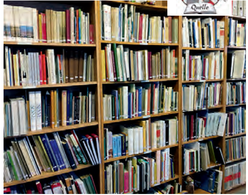
1.400 Bücher warten auf zahlreiche Besucher.

Sie sind Pflegefachkraft, Pflegehilfskraft oder suchen eine Ausbildungsstelle in der Pflege? – Dann sind Sie bei uns genau richtig!