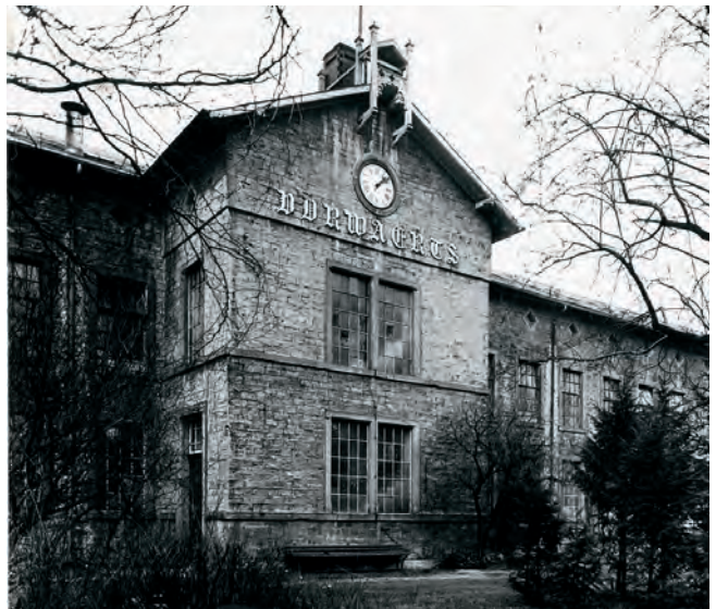
Spinnerei Vorwärts im Zweiten Weltkrieg, 1942 oder 1943