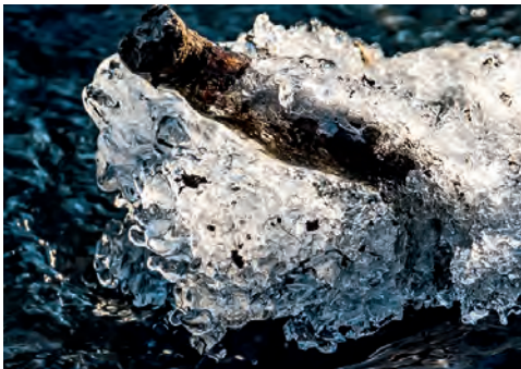
Mit ein wenig Fantasie erkennt man einen „Eis-hund“. (Auf dem Schulbauernhof in Ummeln fotografiert von Dieter Kunzendorf.)

Alle Mitglieder und Förderer des Vereins Naturbad Brackwede sind herzlich eingeladen!