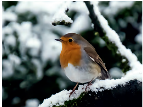
Das Rotkehlchen wartet wie wir auf den Frühling.