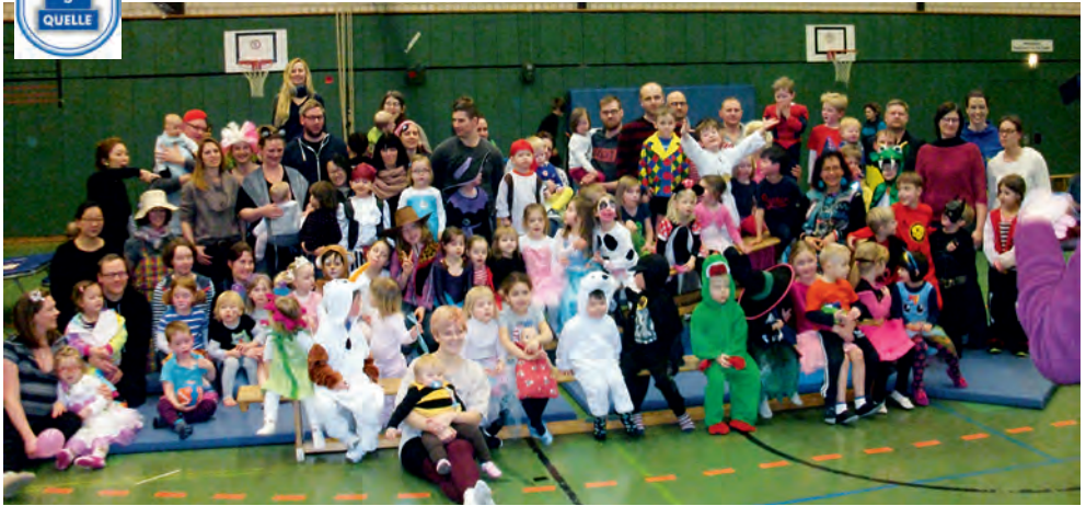
Ein Teil der Eltern-Kind-Gruppe (3 bis 6 Jahre/montags) in der Dreifachturnhalle Marienfelder Straße

Zur Karnevalszeit war, wie in jedem Jahr, in vielen der Gruppen aus der Turnabteilung jede Menge lustiger Trubel!