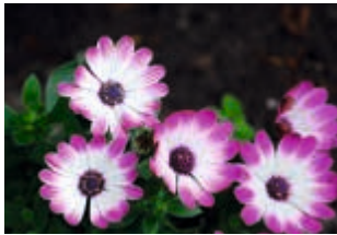
Der Sommer läßt grüßen..