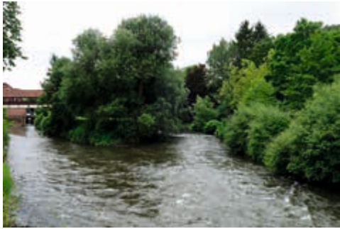
Wo Werra sich und Fulda küssen . . .

Lied über Dr. Eisenbart im Ohr, der viele Jahre hier in Münden praktizierte und die Menschen mit allerlei Wundermitteln heilte. Er kurierte die Leut' nach seiner Art, was man von so manchem Doktor auch heute noch sagen kann. Danach war es Zeit, dem fließenden Wasser die Aufwartung zu machen. Mit einem Ausflugsboot ging es durch die Schleuse hinaus auf die Fulda in Richtung Kassel und zurück, geschleust im Bogen über die Weser, und das gemütlich bei Kaffee und Kuchen.