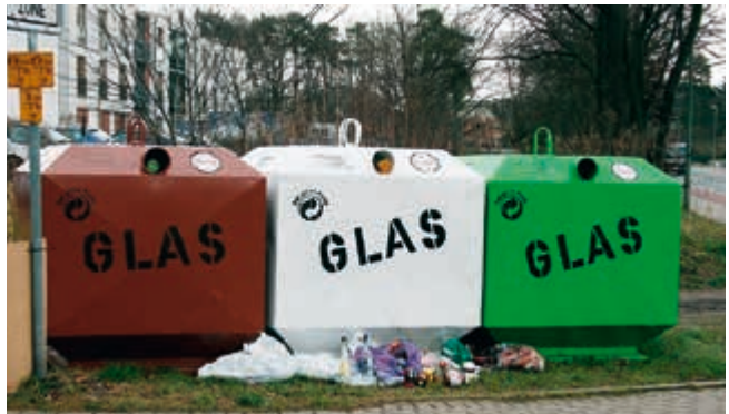
Kein schöner Anblick: Altglascontainer vor der städt. Kita „Auf dem Rennplatz“

Mit den Schlagworten „Quelle ist I(i)ebenswert“ und „Unser Herz schlägt für Quelle“ verbinden viele einheimische Bürger ein positives Bild unseres Ortsteils. Dieses Bild hat eine gewaltige Macke erhalten. Mitten im Ort hat der Umweltbetrieb der Stadt Bielefeld drei Container für die Altglassammlung aufstellen lassen. Beim Wettbewerb „Unser Dorf soll schöner werden“ ist mit dieser Maßnahme bestimmt kein Preis zu gewinnen. Viele Queller Bürger fragen sich, warum mitten im Ort ein derartiger Schandfleck entstehen muss. Ein Standort für die drei Container, der nicht direkt im Blickpunkt der