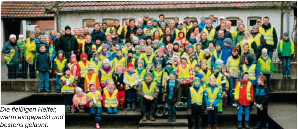
Die fleißigen Helfer, warm eingepackt und bestens gelaunt.

Neuer Spendenrekord bei der Weihnachtsbaumaktion: 5.525,61 Euro haben Schüler, Eltern und Lehrer der Queller Grundschule am 10. Januar gesammelt, eine deutliche Steigerung gegenüber dem Vorjahr. Nachdem die Erlöse aus den vergange-